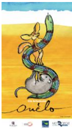
Ouèlo (2019) conte musical

Pour le jeune public de trois à huit ans :