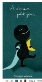
A demain petit jour (2013)