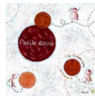
Petite terre (2010)