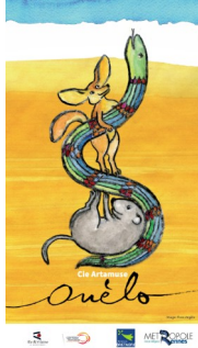
« Ouèlo » (2019) conte musical

Pour le jeune public de trois à huit ans et les adultes qui les accompagnent :