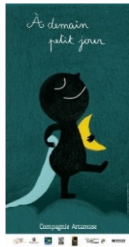
« A demain petit jour » (2013)