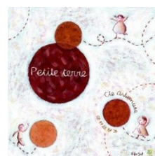
« Petite terre » (2010)